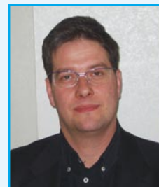
On. Matteo Bragantini Assessore alla Cultura Popolare e all'Identità Veneta della Provincia di Verona

Un ringraziamento alla Fondazione Atlantide Teatro Stabile di Verona e a quanti hanno reso possibile questo festival.